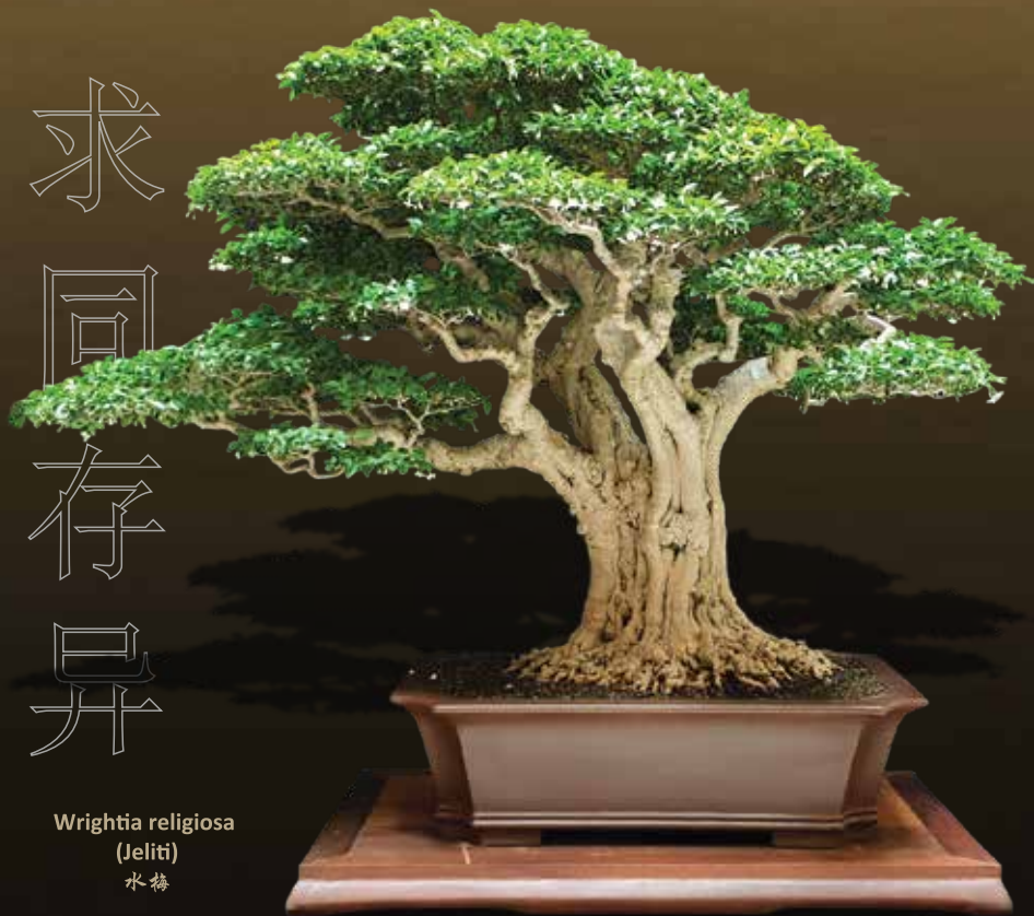
Wrightia religiosa (Jeliti) 水梅